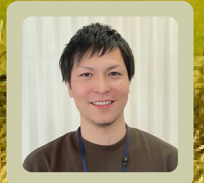
北ブロック長 (向陽台病院)