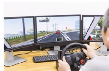
ドライブシミュレーター